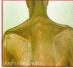
Aşırı kilo kaybı

Ateş (>39°C), halsizlik, aşırı yorgunluk ve kilo kaybı, terleme, ishal, lenf bezlerinde büyüme, deride çürüğe benzer leke ve şişliklerin görülmesi, nezle ve grip gibi basit hastalıkların çok uzun sürmesi, sık sık hasta olmak.